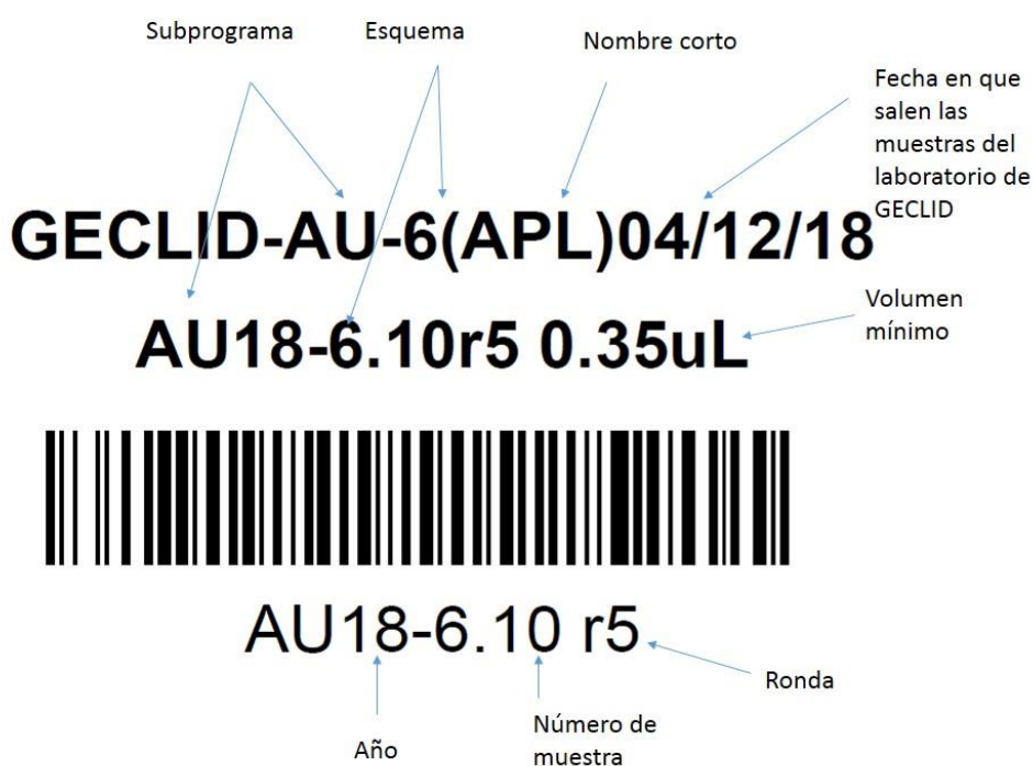
Figura 1. Identificación de muestras