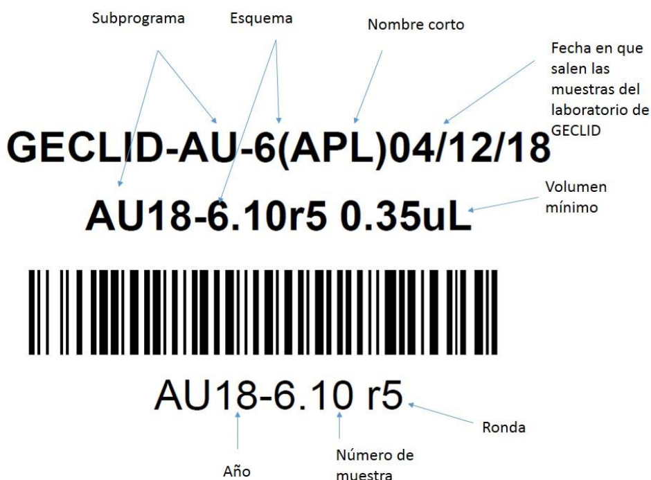
Figura 1. Identificación de muestras